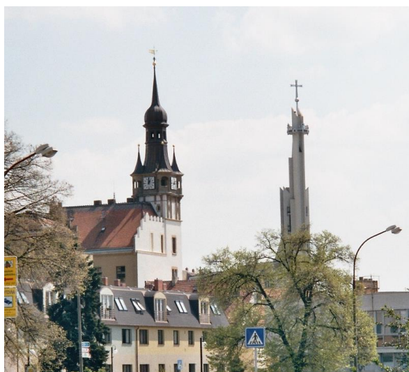
Pravá moderní věž patří kostelu sv. Václava a sv. Anežky České.

Po příjezdu do Hustopečí většinu návštěvníků zaujme pohled na zajímavé věže na náměstí.